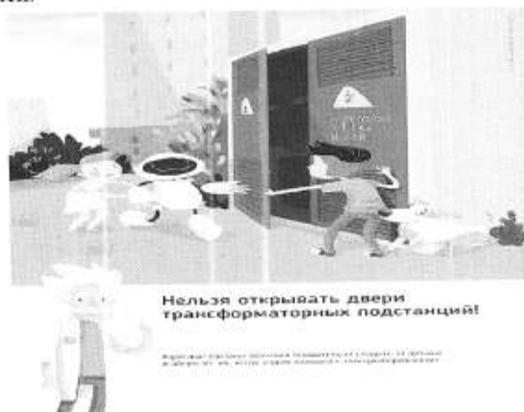
Рис.1 Нельзя открывать двери трансформаторных подстанций

Ежегодно энергетики проводят для школьников познавательные уроки, конкурсы рисунков и историй на тему электричества и правильного с ним обращения. Но работы одних энергетиков в данном направлении недостаточно, для полного понимания проблем электробезопасности нужен пример общества, в котором растет ребенок, и, конечно же, главным образом родителей. Эта работа приносит свои результаты: электротравмы на энергетических объектах единичные, и каждый случай становится поводом для служебной проверки. Но только технических мер мало для того, чтобы полностью обезопасить детей. Им нужен пример родителей.